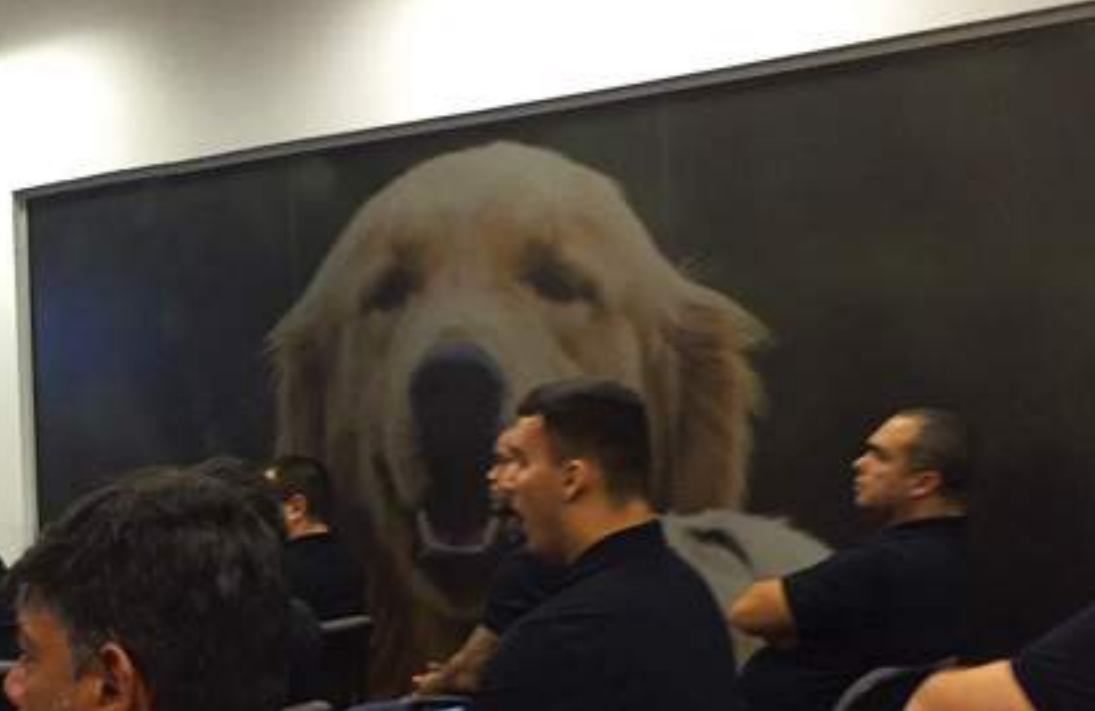
Workshop Royal Canin