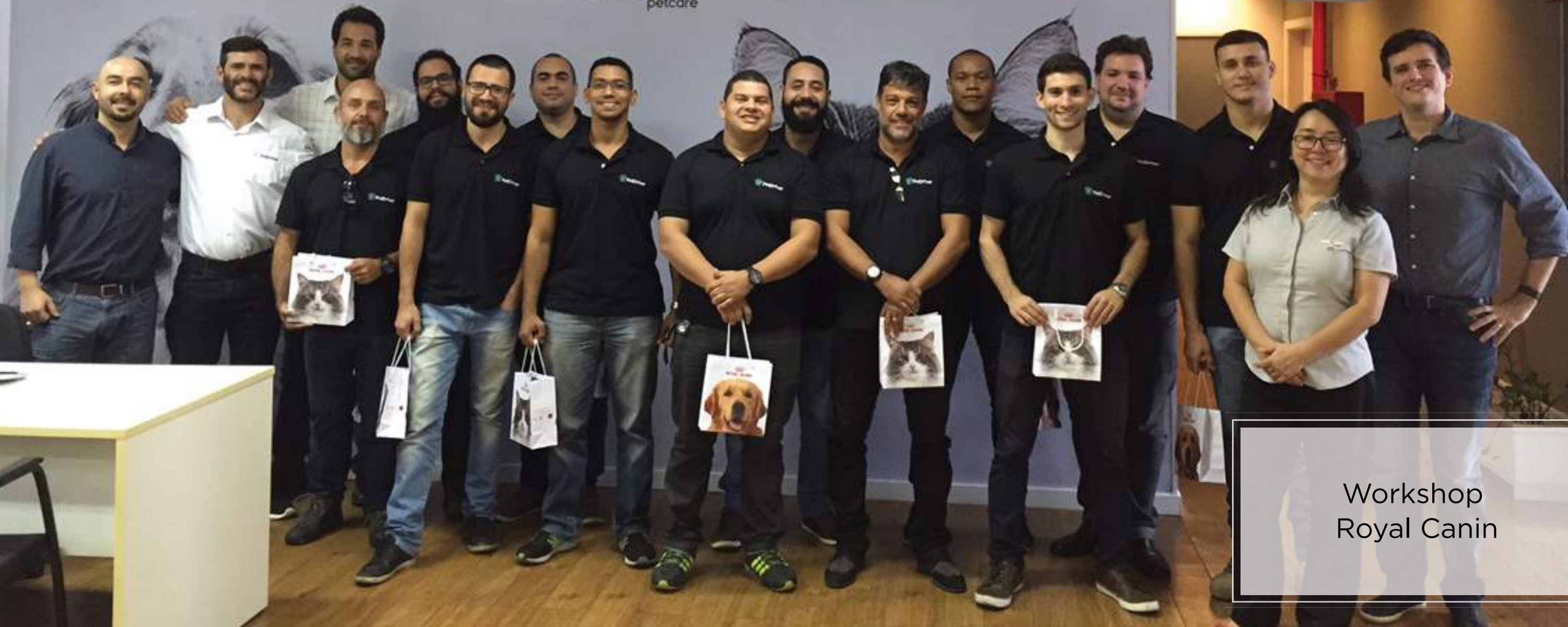
Workshop Royal Canin