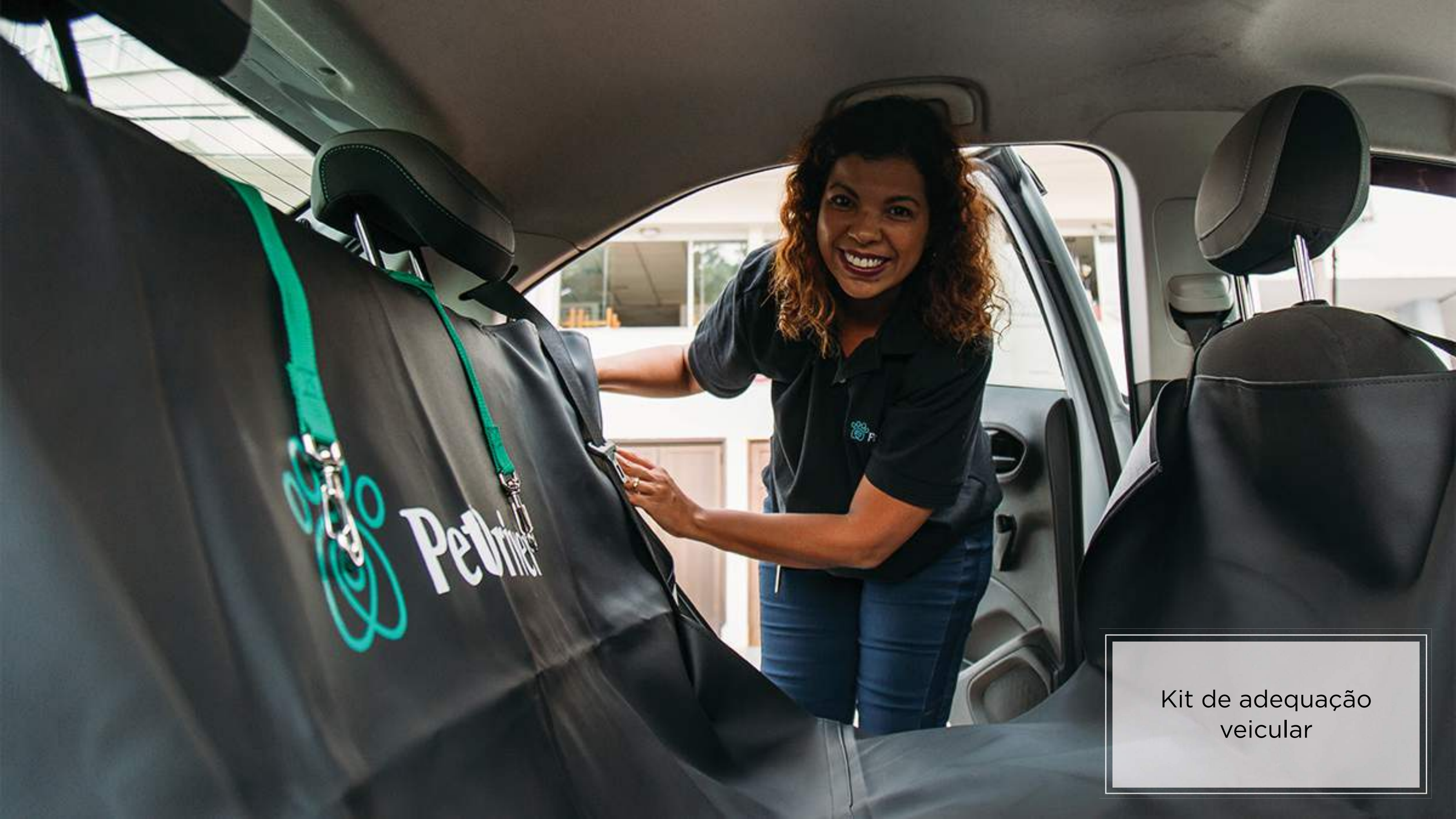
Kit de adequação veicular