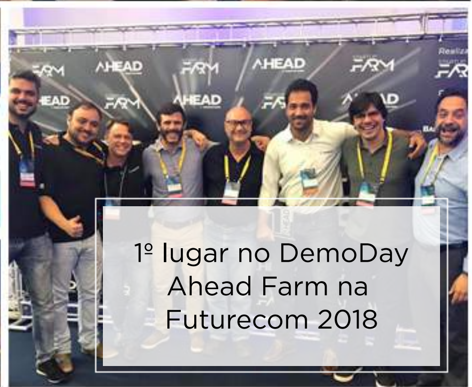
1º lugar no DemoDay Ahead Farm na Futurecom 2018